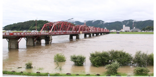
図1 四万十川の洪水時における観測状況

超音波ドップラー多層流向流速計(ADCP)を用いた河川における洪水流況や超音波技術を用いた土砂量計測技術の高精度化に関する研究・開発を行っている。